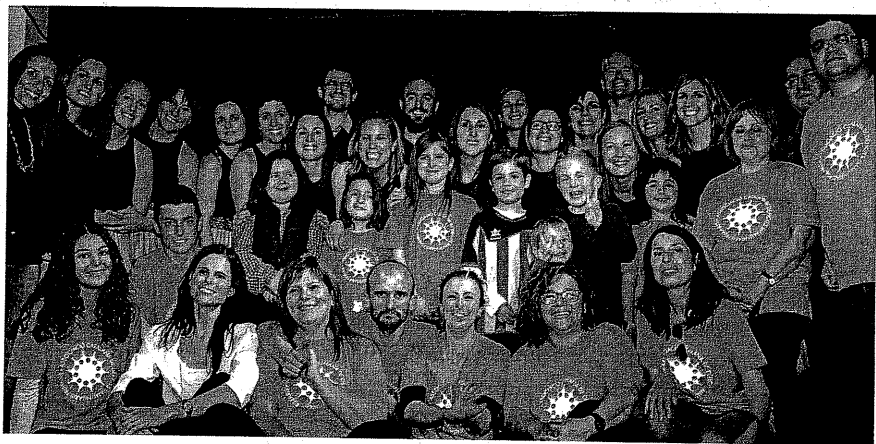
Membres d'ACADIP, entre els que hi ha diversos rodencs, amb els artistes que van actuar al Casino de Vic.

Del 22 al 29 d'abril va tenir lloc la Setmana Mundial de les Immundeficiències Primàries i ACADIP va organitzar un acte al Casino de Vic per donar-li ressò. Aquesta entitat aglutina les famílies amb nens i nenes que pateixen una malaltia d'aquest tipus, que són molt minoritàries i cròniques. Demanen que s'intensifiqui la recerca i que s'investigui, per la qual cosa, falten també més recursos. Com més investigació, més esperança per als malalts i les seves famílies. També es demana, per exemple, que la detecció de les idp's s'inclouï dins el cribatge